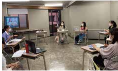
インターンシッププログラム オリエンテーションにて